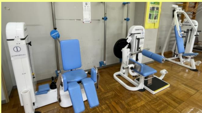
○最新トレーニングマシン6台設置!